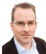
Michael Erkes Chr. Hansen GmbH